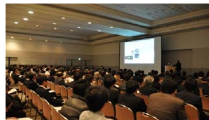
2nd Summit (2010)