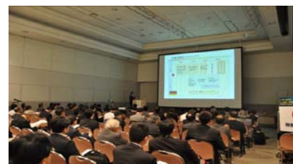
3rd Summit (2011)