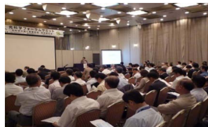
1st Summit (2009)